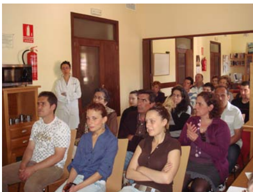
Familiares y usuarios durante el grupo de familias.