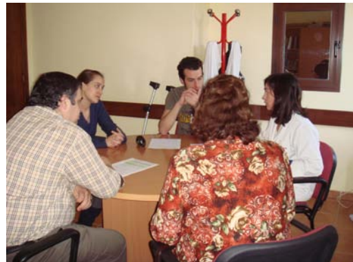
Psicóloga durante una intervención individualizada con una de las familias.