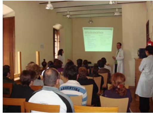
Inicio de la sesión psicoeducativa con psicóloga, director C.T.(maestro) y tutora referencial.