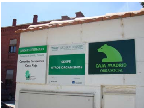
Imagen de la entrada a la C.T. Casa Roja – ALUCOD con cartel de Obra Social Caja Madrid: